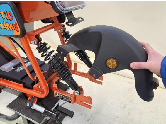
Ota takalokasuoja pois.