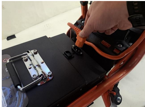
Irrota akun pistoke akusta.