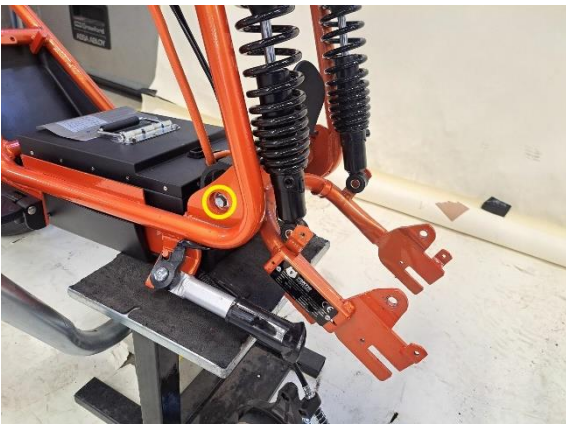
Irrota takahaarukan akselipultti (hylsy 14 mm, 12 mm).