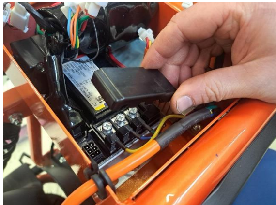
Irrota moottorin vaihe kytkentöjen suoja Ohjainlaitteesta.