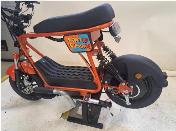
Nosta laitteen takaosa ylös (koroke).