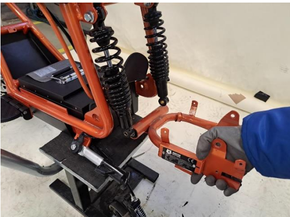
Ota takahaarukka pois.

Uuden osan asennus käänteisessä järjestyksessä.