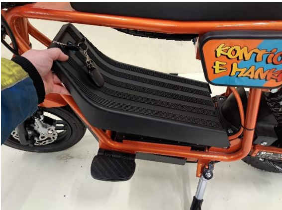
Ota akkukotelon kansi pois.